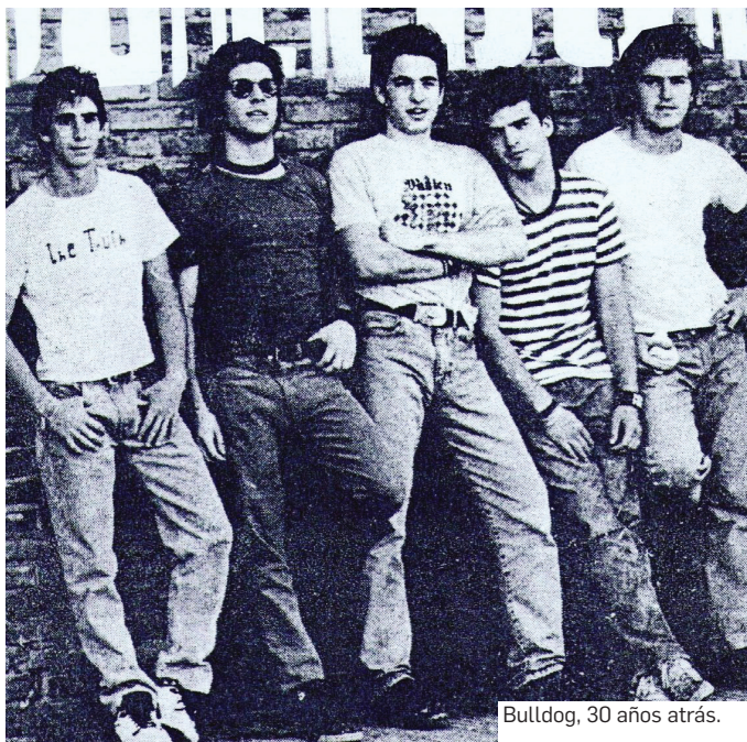
Bulldog, 30 años atrás.